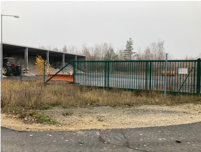
Salzlager des Tagebaus Nochten