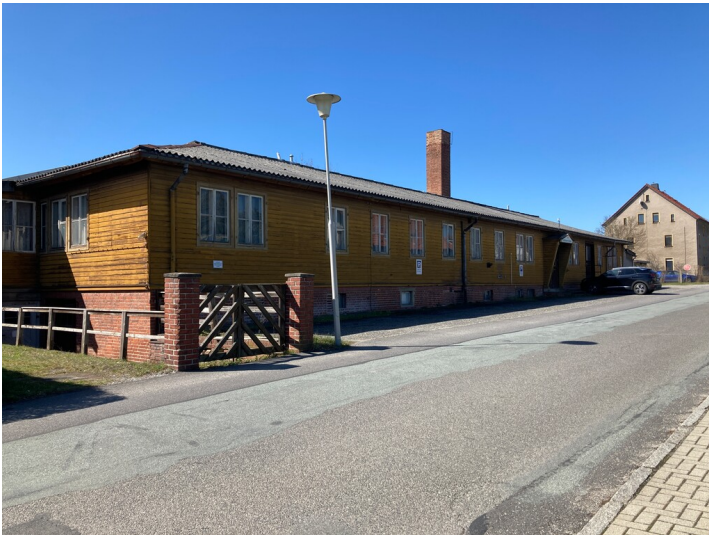
FOKORAD-Bürogebäude, Ansicht von Nordosten