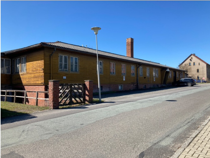
FOKORAD-Bürogebäude, Ansicht von Nordosten