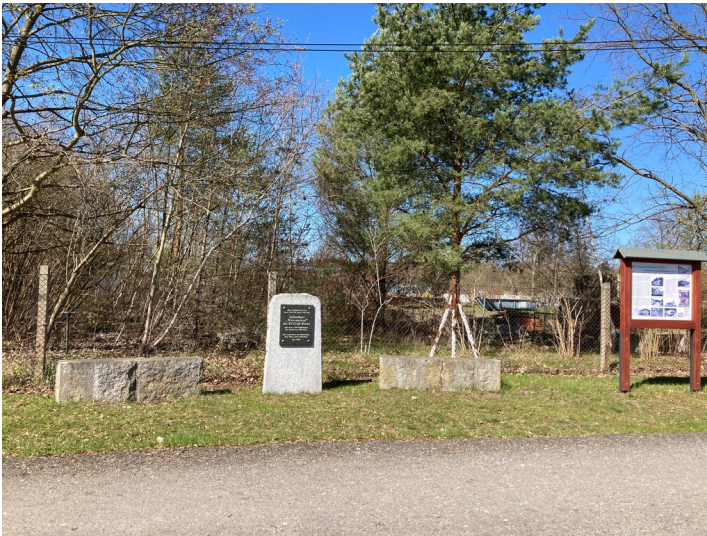
Gedenkstein für das Außenlager Wiesengrund des KZ Groß-Rosen, Ansicht von Osten