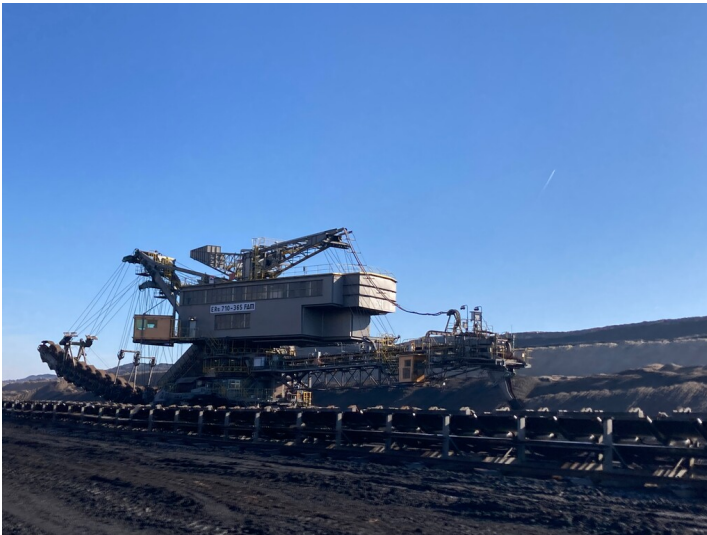
Eimerkettenbagger ERs 365 710 im Tagebau Reichwalde