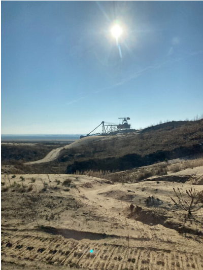
Schaufelradbagger 1571 SRs 2000 im Tagebau Reichwalde