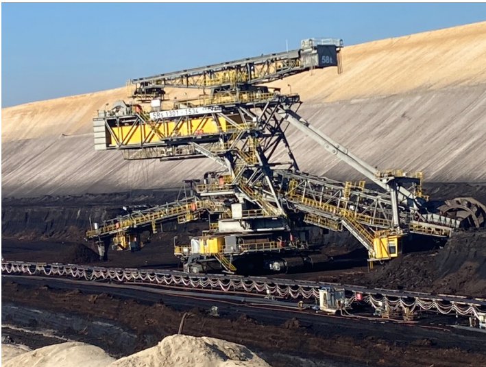
Schaufelradbagger 1534 SRs 1301 im Tagebau Reichwalde