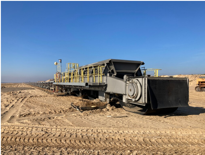
Abraumbandanlage des Tagebaus Reichwalde aus mehreren Einzelbändern und Bandantriebsstationen