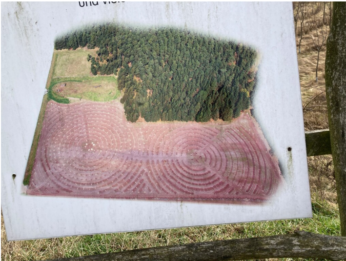
Obstgartenanlage "Essbarer Wald" Hammerstadt, Infotafel Aufbau