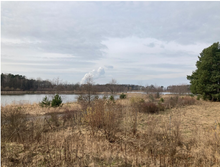
Neue Hammerstädter Teiche, Ansicht von Nordosten