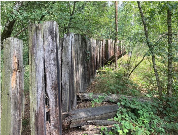
Absetzbecken des ehemaligen Tagebaus Heide