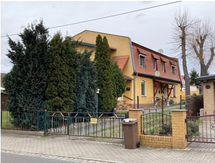
Arbeiterwohnhaus der Braunkohlegrube Hermann in Weißwasser, Teichstraße 52