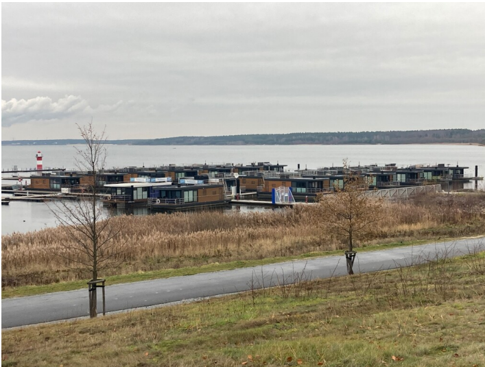
Marina Klitten am Bärwalder See