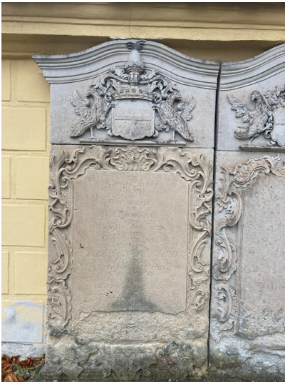
Grabstein aus dem devastiertem Ort Merzdorf auf dem Friedhof Uhyst