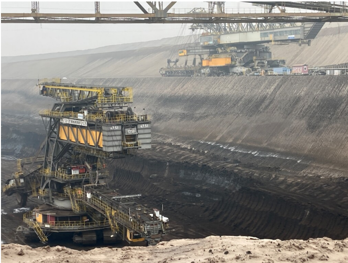
Schaufelradbagger 1535 SRs 1301 im Tagebau Nochten