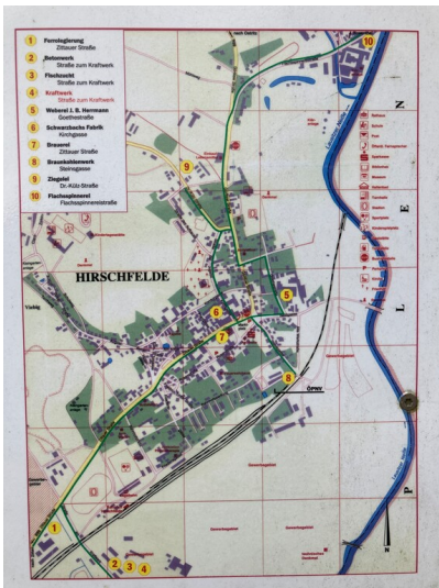
Wanderweg und Lehrpfad Historischer Hirschfelder Industriepfad