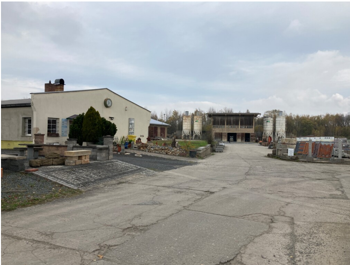
Betonwerk Hirschfelde, Ansicht von Südwesten