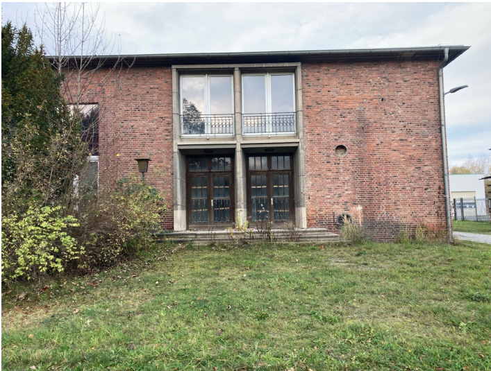
Ehemaliger Speisesaal mit Küche des Kraftwerkes Hirschfelde, Ansicht Eingangsbereich von Südosten