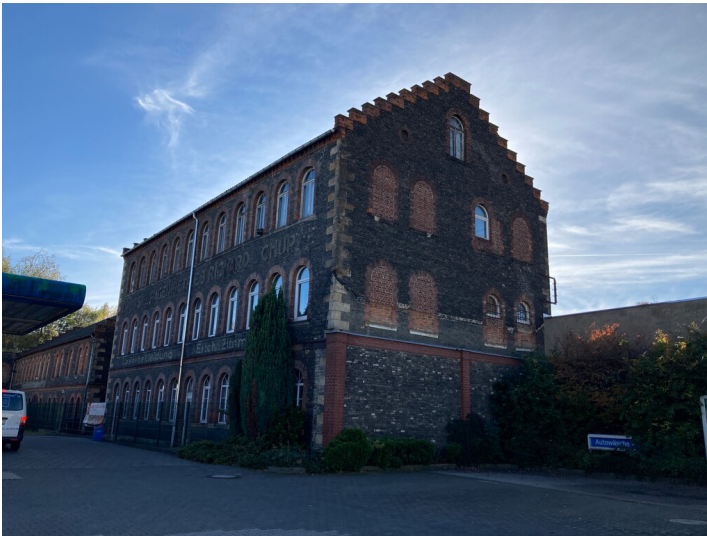
Fabrikeanlage mit Schornstein und Garagenkomplex, Ansicht von Norden