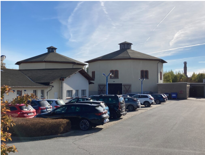
Ehemalige Gaswerke Zittau, Ansicht Zwillingbehälter von Norden