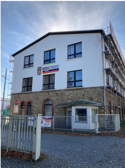
Metallverarbeitende Fabrik, Ansicht Verwaltungsgebäude von Norden