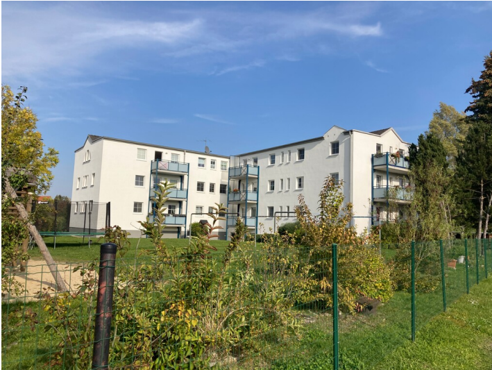
Ehemaliges Elektrizitätswerk Olbersdorf, Ansicht von Westen