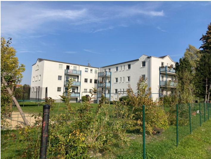
Ehemaliges Elektrizitätswerk Olbersdorf, Ansicht von Westen