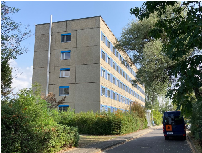
Bürogebäude des VEB Gerüstbau Hoyerswerda, Ansicht von Südwesten