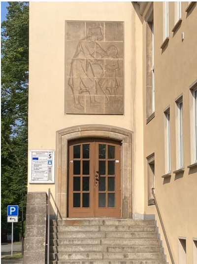
Ehemalige Poliklinik Hoyerswerda, Detailsicht Relief