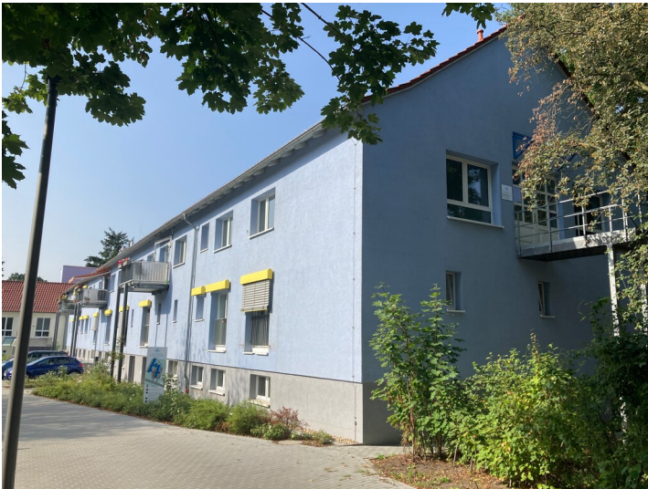
Ehemalige Frauenklinik im Wohnkomplex Elsterbogen, Ansicht von Norden

Schlagwörter: Krankenhaus Fachsicht(en): Denkmalpflege Gemeinde(n): Hoyerswerda Kreis(e): Bautzen Bundesland: Sachsen