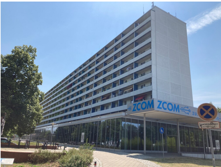
Zusemuseum Hoyerswerda, Ansicht von Nordwesten