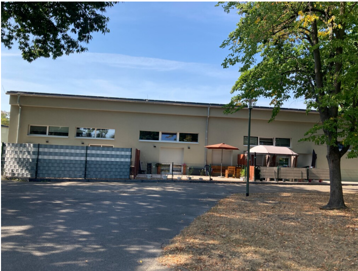
Versorgungszentrum Wohnkomplex V, Ansicht von Nordwesten