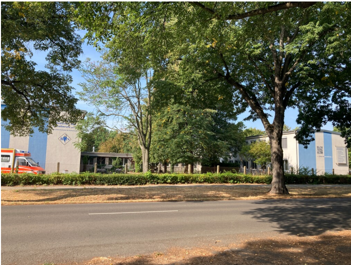
Kinderkombination (Kindergarten und Kinderkrippe) im Wohnkomplex V, Straßenansicht von Nordosten