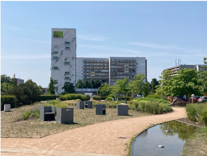
Stadtspark Hoyerswerda/Neustadt mit Statue für Brigitte Reimann "Die Liegende", Ansicht von Osten

Schlagwörter: Park, Skulptur Fachsicht(en): Denkmalpflege Gemeinde(n): Hoyerswerda Kreis(e): Bautzen Bundesland: Sachsen