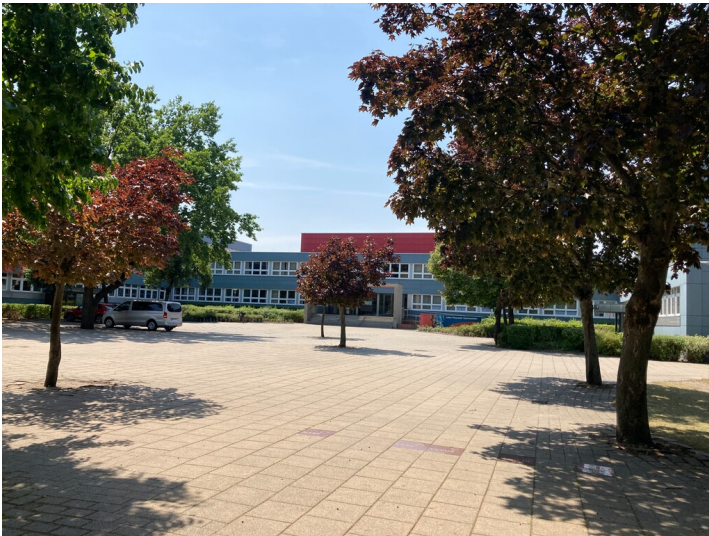
Ehemalige Schule des Wohnkomplex Stadtzentrum in Hoyerswerda/Neustadt