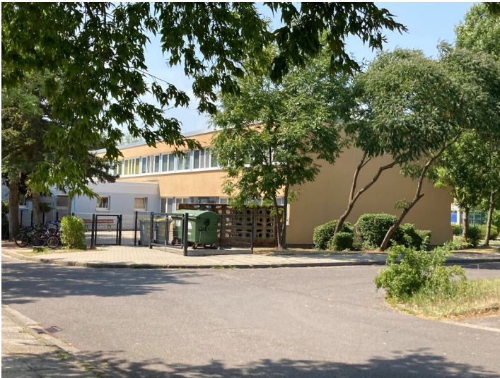
Kinderkombination Straße des Friedens 19, Hoyerswerda, Ansicht von Osten