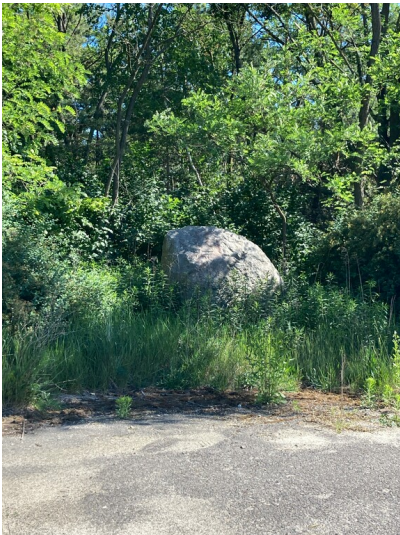
Findling im Bereich der Brikettfabrik Clara III, später Zeißholz