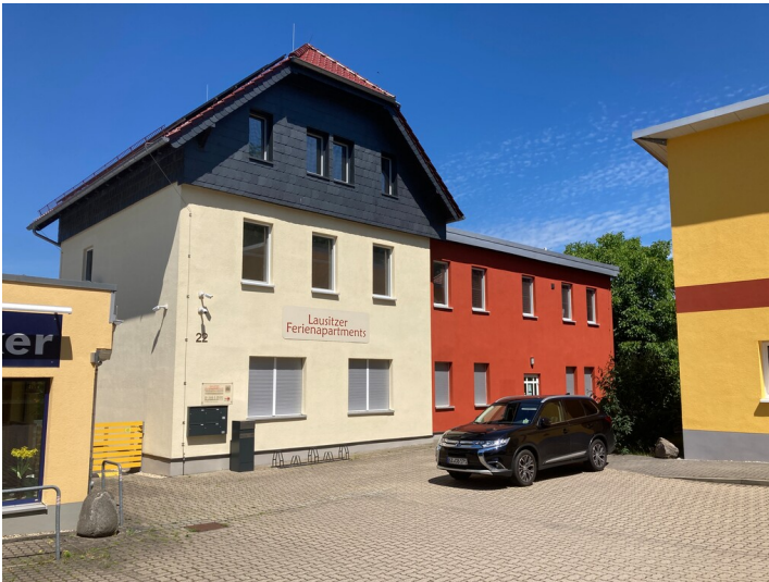
Wohnhaus, Ansicht von Südosten