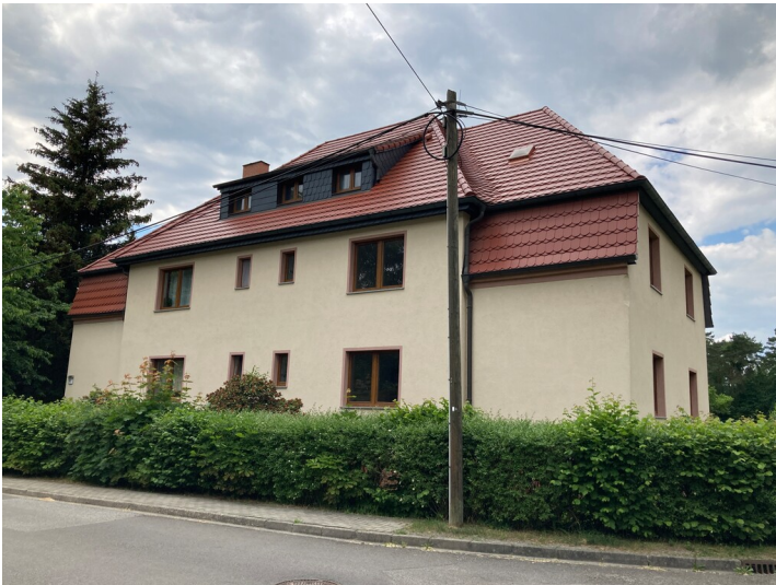
Doppelwohnhaus der Werkssiedlung Heye III, Ansicht von Nordosten