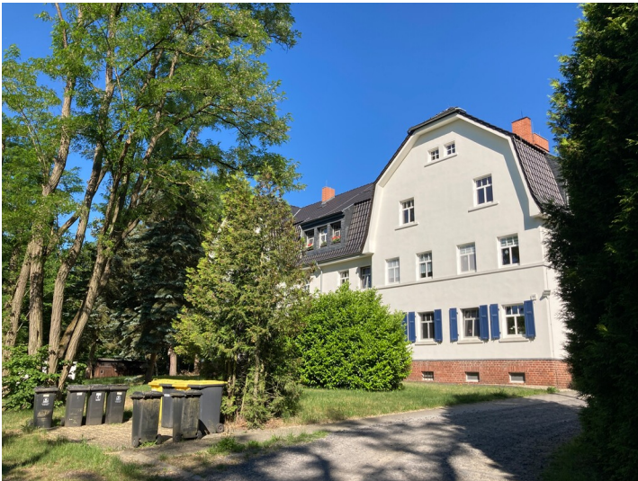
Kolonie Zeiholz, Arbeiterwohnhaus, Vorderansicht