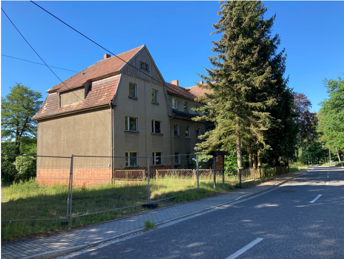
Arbeiterwohnhaus der Kolonie Zeiholz, Ansicht von Nordosten