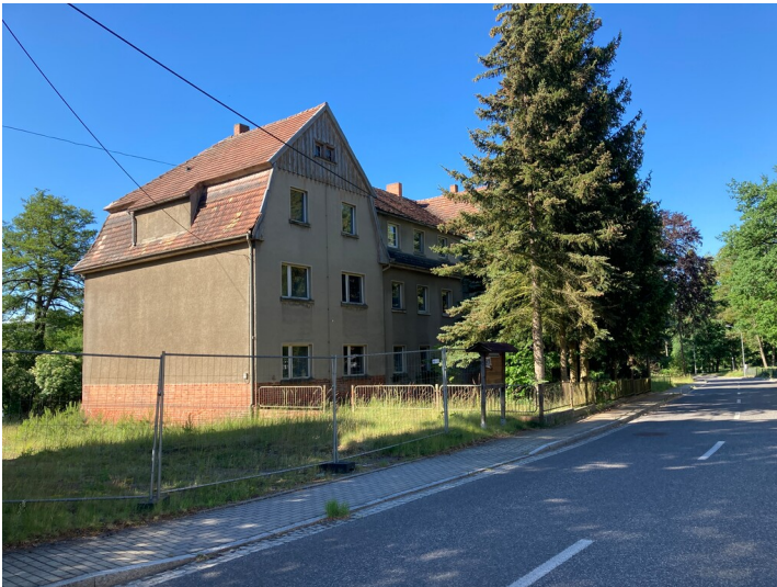
Arbeiterwohnhaus der Kolonie Zeißholz, Ansicht von Nordosten