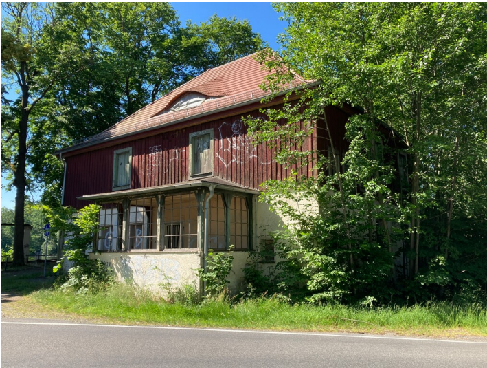
Gasthof, Ansicht von Osten