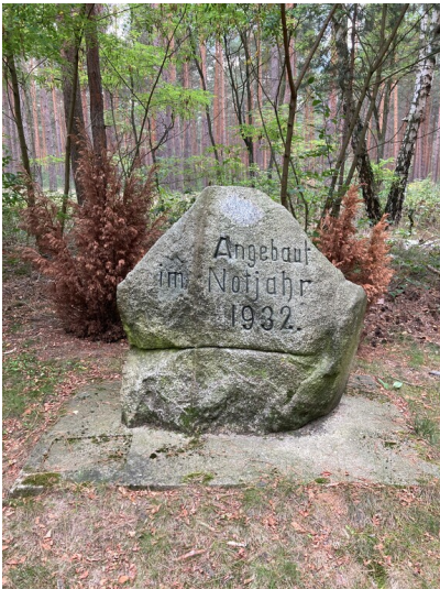
Gedenkstein zur Aufforstung bei Bernsdorf