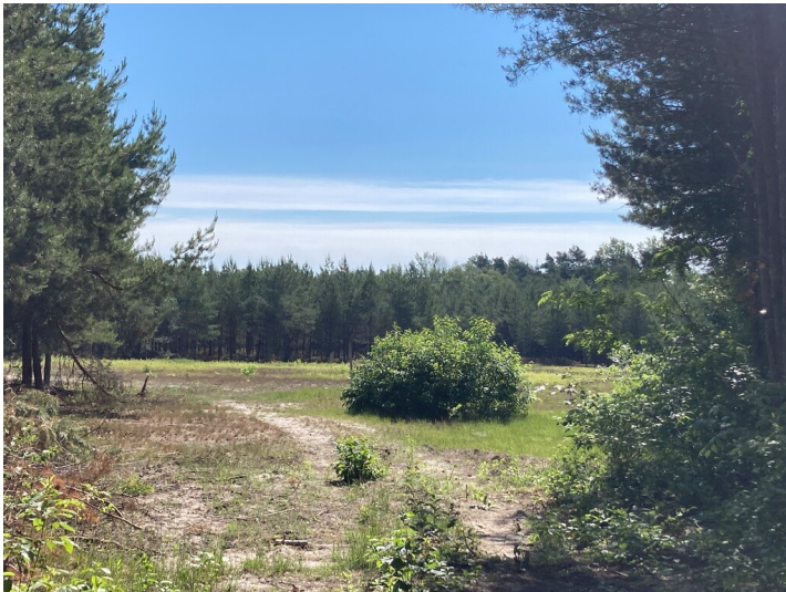
Klärteich, Ansicht von Westen