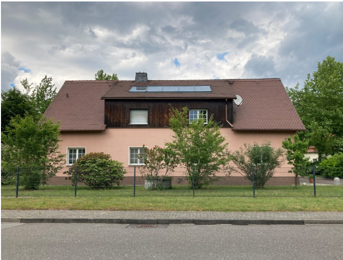
Mehrfamilienwohnhaus und ehemaliges Kaufhaus der Werkssiedlung Heye III, Straßenansicht von Süden