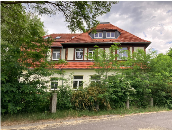
Ehemalige Schule der Werkssiedlung Heye III, Straßenansicht von Osten