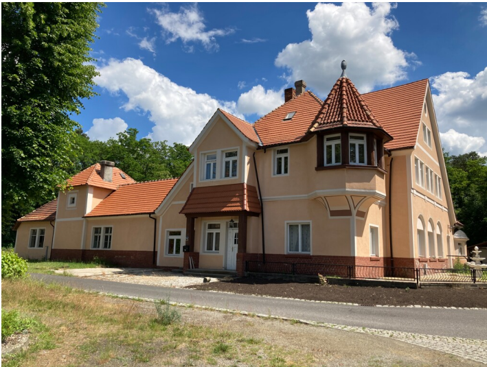
Ehemaliges Gasthaus der Werksiedlung Heye III, Ansicht von Westen