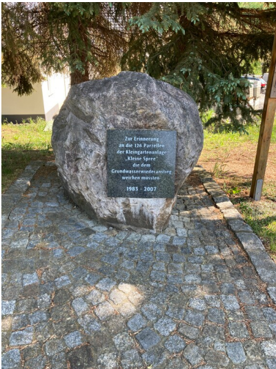
Gedenkstein für die Kleingartenanlage Burghammer, Ansicht von Südwesten