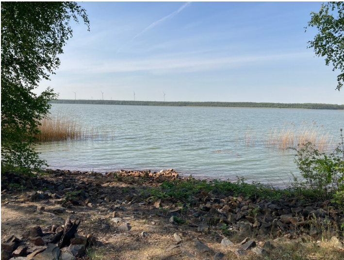
Tagebaurestsee Bernsteinsee