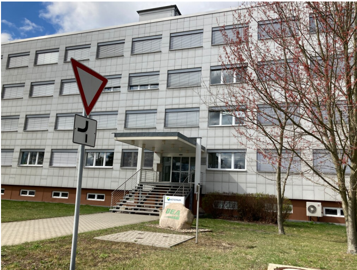
Bürogebäude Schwarze Pumpe, Ansicht von Nordosten

Schlagwörter: Bürogebäude Fachsicht(en): Denkmalpflege Gemeinde(n): Spreetal Kreis(e): Bautzen Bundesland: Sachsen