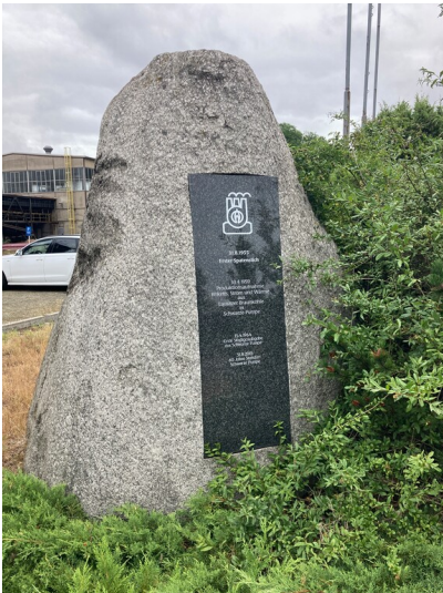
Gedenkstein für den Aufbau Schwarze Pumpe