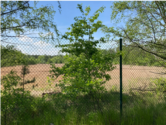
Teerseen Zerre