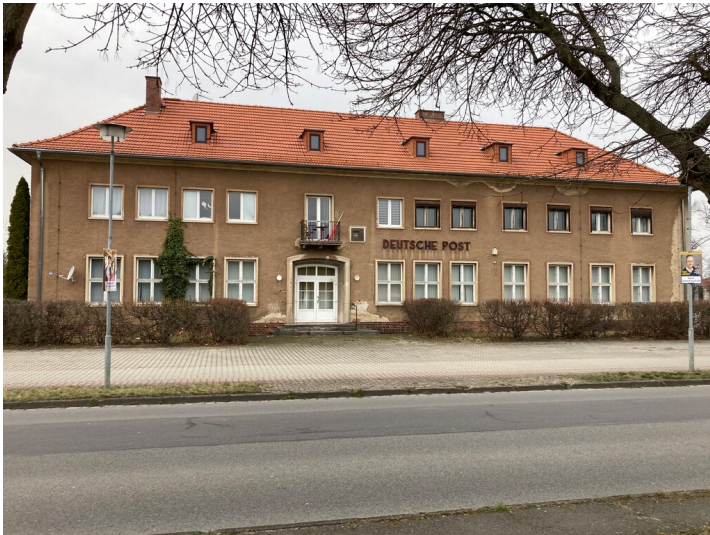
Post Lautau-West, Ansicht von Osten