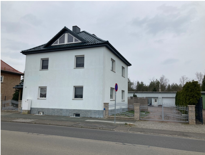
Wohnhaus Mittelstraße Nr. 7 in Lauta, Ansicht von Westen