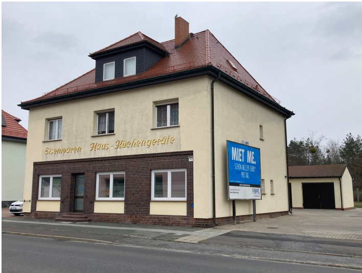
Wohnhaus mit Ladengeschäft, Ansicht von Westen

Schlagwörter: Wohnhaus Fachsicht(en): Denkmalpflege Gemeinde(n): Lauta Kreis(e): Bautzen Bundesland: Sachsen