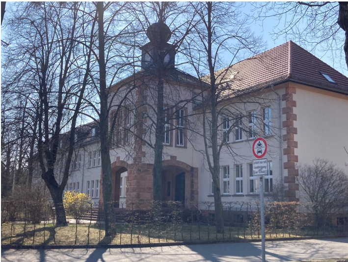
Mittelschule Lauta, Ansicht von Osten